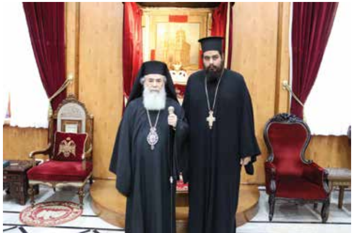
غبطة البطريرك ثيوفيلوس الثالث مع الاب لوقا بوشة

ويختتم حديثه بالتأكيد على أنّ القيامة حاضرةً في كلّ قدّاسٍ إلهيٍّ، حيث تتجدّد في قلوب المؤمنين من خلال إعلان "إذ قد رأينا قيامة المسيح"، مُعتبرًا أنّ هذه اللحظة تُجسّد جوهر