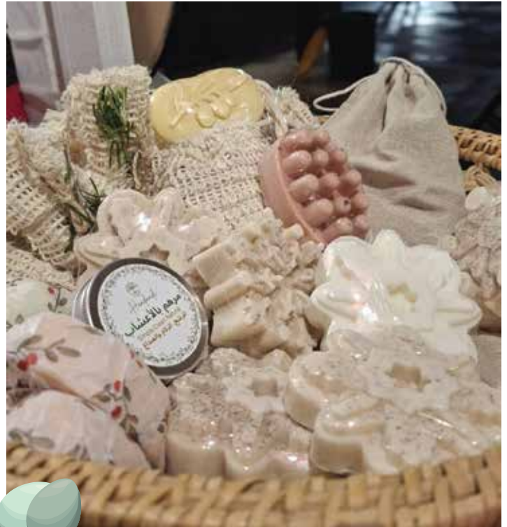
صورة لمنتجات أرضي

عندما نصنع شيئاً من مواردنا، فنحن نروي قصة صمودنا. كلّ منتجٍ هو رسالة صامتة تقول: (أنا هنا، هذه أرضي، وهذه هويتي)".