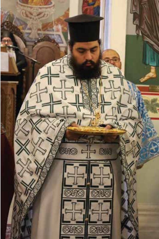
الأب لوقا بوشة

الأب لوقا بوشة: القيامة أسلوب حياة يومي... والجمعة العظيمة ليست للحزن بل للرجاء