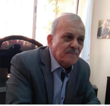
اللواء المتقاعد عماد معاينة